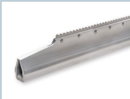
Stege / Cleats