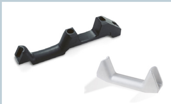
Spurbügel / Tireguide