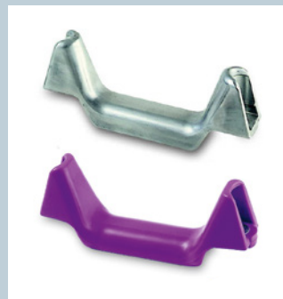
Spurbügel / Tireguide

© HANS HALL GmbH, 06/2024 Änderungen, Druckfehler und Irrtümer bleiben vorbehalten. Farbabweichungen in den Abbildungen von den Original-Produkten sind drucktechnisch bedingt. Changes, misprints and errors excepted. Color deviations are due to printing technology.