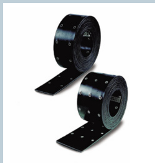
Bänder / Belts