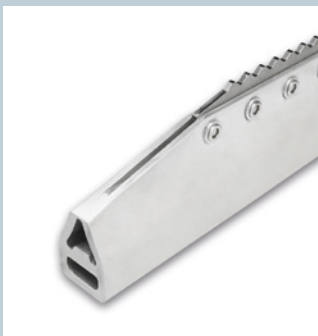
Steg / Cleats