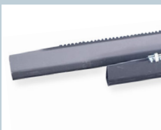
Steg / Cleats