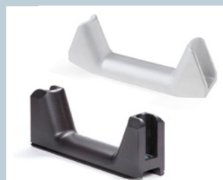
Spurbügel / Tire guides

© HANS HALL GmbH, 06/2024 Fotonachweise / Photo credits: Ingo Rack, HANS HALL, Adobe Stock. Änderungen, Druckfehler und Irrtümer bleiben vorbehalten. Farbabweichungen in den Abbildungen von den Original-Produkten sind drucktechnisch be- dingt. Changes, misprints and errors excepted. Color deviations are due to printing technology.