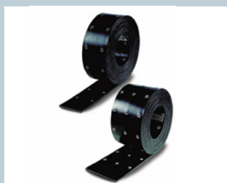
Bänder / Belts